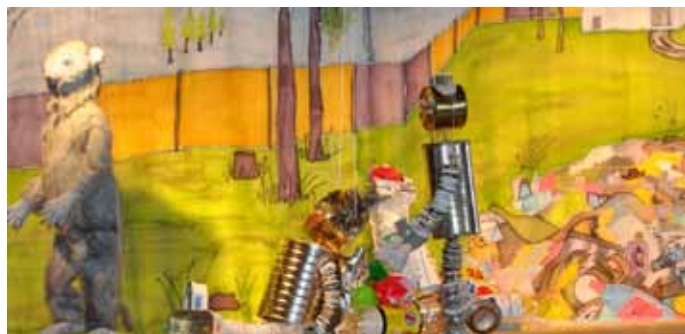
Lebendige Umwelterziehung an der Grundschule Schwanfeld

Das Lari-Fari Puppentheater war im Februar mit dem Stück „ Quatsch, kein Blech! “ zu Gast an der Schwanfelder Grundschule. Gefördert wird das Puppentheater von der Kulturstiftung Unterfranken und insbesondere diese Marionettengeschichte vom Umweltamt des Landkreises Miltenberg, weil es den Kindern spielerisch die Wichtigkeit der Müllverwertung näher bringt. Nicht nur die Erst- und Zweitklässler waren eingeladen, sondern