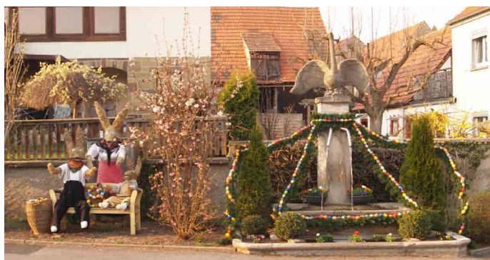
Herzlichen Dank dem Verein für Volkstanz und Brauchtumspflege für den schönen Osterschmuck.

Gemeinderat und Bürgermeister wünschen allen Bürgerinnen und Bürgern sowie allen Gästen in unserer Gemeinde ein frohes und gesegnetes Osterfest. Den Schülern wünschen wir sonnige und erholsame Ferientage.