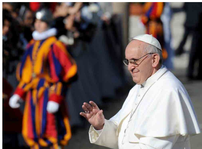
Papst Franziskus: „Seid Hüter der Gaben Gottes!“