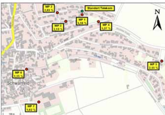
Anlage 3: Lageplan mit den Messpunkten

An jedem Messpunkt ist der im Rahmen der "Nachhermessung" festgestellte Mobilfunk-Immissionswert (für Maximalauslastung und Vollausbau der Anlagen) in Prozent vom Grenzwert nach 26. BImSchV ("Grenzwertausschöpfung" bezüglich der elektrischen Feldstärke) angegeben.