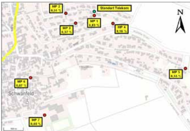
Anlage 3: Lageplan mit Anlagenstandort und den Messpunkten

An jedem Messpunkt ist der im Rahmen der "Vorhermessung" vom Oktober 2013 aktuell festgestellte Mobilfunk-Immissionswert (für Maximalauslastung und Vollausbau der derzeit vorhandenen Anlagen) in Prozent vom Grenzwert nach 26. BImSchV (bezüglich der elektrischen Feldstärke) angegeben.