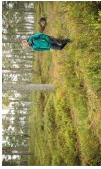
Vorsicht: Bis zu 50 verschiedene Krankheitserreger können Zecken übertragen.

Zeckenvorsorge bei Geocacher Beim Geocaching handelt es sich um eine Schatzsuche mit GPS-Geräten: Die im Freien versteckten Behältnisse müssen anhand von Koordinaten gefunden werden. Bei der Suchenachem, "Cache", begeben sich die Abenteuerer in Wälder, Wiesen, kriechen durch Laub und Unterholz und befinden sich dabei mitten im Zeckenrevier. Zecken können ab sieben Grad Celsius aktiv sein, durch