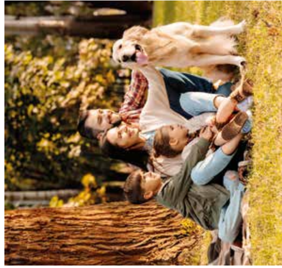
Zeckenschutz: Der Klimawandel bringt zunehmend Gefahren für Mensch und Tier.